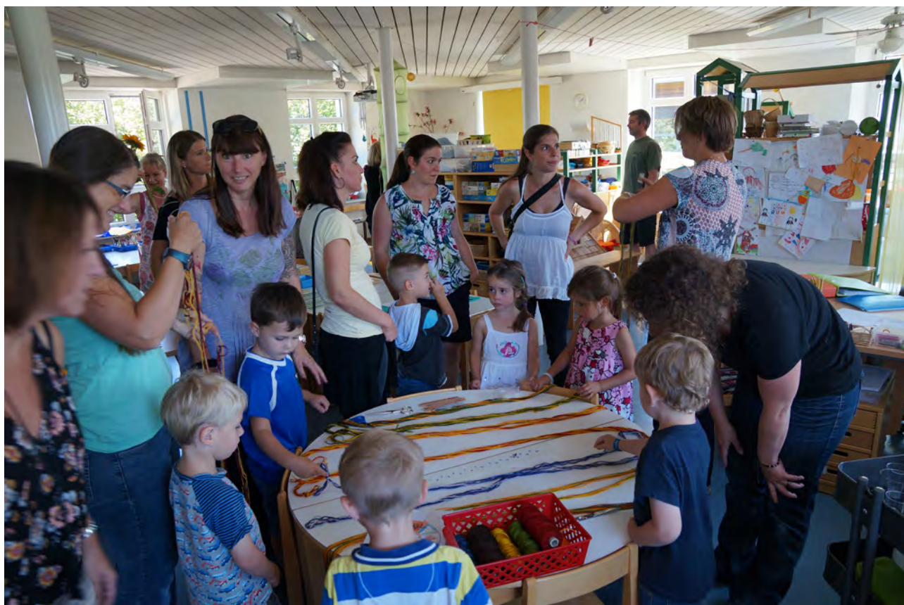
Begrüßung der neuen Kindergartenkinder