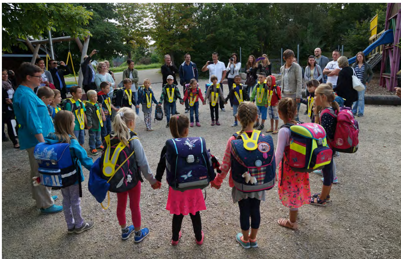
Begrüßung der 1.-Klässler im Schulhaus Langacker