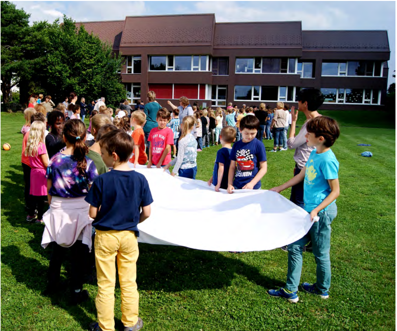
Verabschiedung der 6.-Klässler nach 8 Jahren

Rituale bilden den Höhepunkt im Schuljahr – sie fördern und stärken die Gemeinschaft und das Zusammengehörigkeitsgefühl!